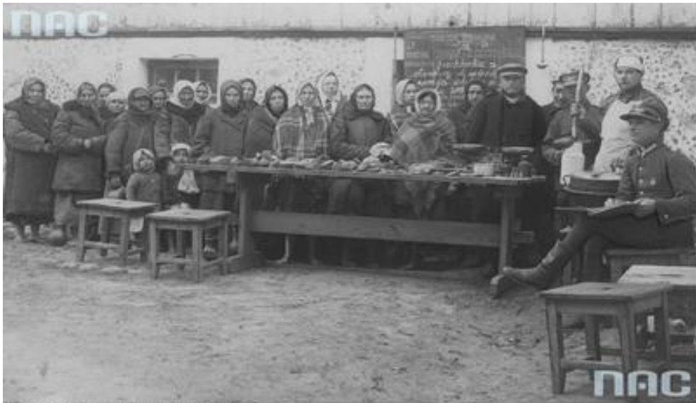
Narodowe Archiwum Cyfrowe, sygn. 1-W-1763

Джерело : Narodowe Archiwum Cyfrowe (NAC), zesp. Koncern Ilustrowany Kurier Codzienny – Archiwum Ilustracji, sygn. 1–W–1763. Wydawanie porcji żywnościowych ludności cywilnej przez kucharza w jednej ze strażnic KOP-u, na granicy polsko-radzieckiej. – [Електронний ресурс]. – Режим доступу: