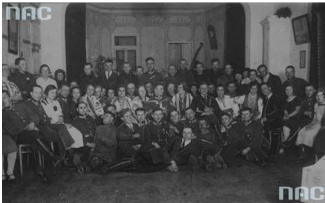
Narodowe Archiwum Cyfrowe, sygn. 1-W-1791

Джерело : Narodowe Archiwum Cyfrowe (NAC), zesp. Koncern Ilustrowany Kurier Codzienny – Archiwum Ilustracji, sygn. 1–W–1791. Amatorski teatr żołnierski w 4 Batalionie Korpusu Ochrony Pogranicza «Dederkały». – [Електронний ресурс]. – Режим доступу: