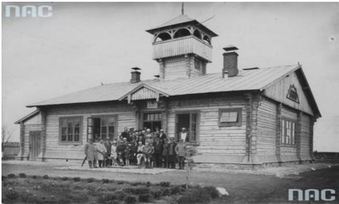
Narodowe Archiwum Cyfrowe, sygn. 1-W-1767

Джерело : Narodowe Archiwum Cyfrowe (NAC), zesp. Koncern Ilustrowany Kurier Codzienny – Archiwum Ilustracji, sygn. 1–W–1767. Fotografia grupowa żołnierzy i ludności cywilnej na tle strażnicy nr 96 KOP-u w Korcu na Wołyniu. – [Електронний ресурс]. – Режим доступу: