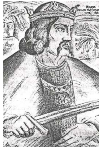
Князь Роман Мстиславович, батько Данила Галицького

Коли в першій чверті XIII століття у південно–східних степах з'явилися перші татарські орди, вони не застали на Русі єдиної держави, подібної до держави Ярослава Мудрого та його синів. Українсько–руська земля давно вже розпалася на окремі землі–князівства, і серед цих земель Київ уже не відігравав ролі політичного центру.