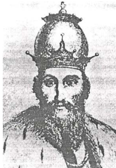
Князь Данило Галицький

Після відходу монголо–татарських полчищ князь Данило починає знову відроджувати державу. Відбудовувались зруйновані міста і села, споруджувалися перші муровані фортеці і потужні замки в Бересті, Столп'ї, Хотині, Кам'янці–Подільському. Саме в цей період було засновано Львів – майбутню столицю Галицької землі, а ще раніше Холм (1237 р.), куди й переніс князь свою резиденцію з ненадійного Галича. Огляд сучасних топографічних назв поселень Волині вказує на те, що ряд сіл, заснування яких не засвідчено історичними джерелами, розпочинають відлік свого існування саме з часів Романовичів. На старе походження вказують назви населених пунктів сучасної Волині – Романів, Романівка, Радомишль, Бушковичі, Борятин, Данилів та ін.