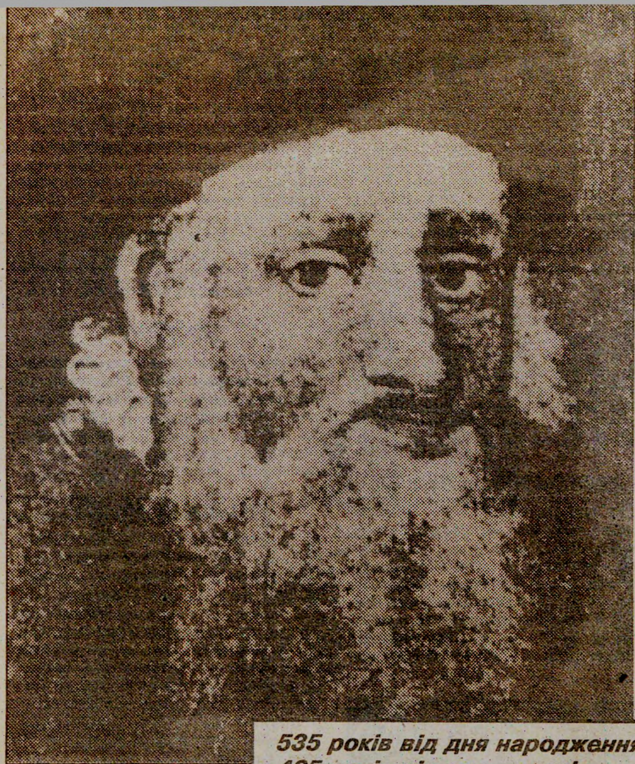
535 років від дня народження 465 років від дня смерті

Олександр БУЛИГА, старший науковий працівник Рівненського краєзнавчого музею