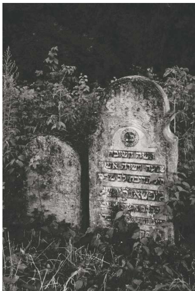
Мацеви на єврейському кладовищі Здолбунова. 08.07.2024 року.