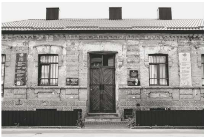
Приміщення Здолбунівського краєзнавчого музею. 08.07.2024 року.