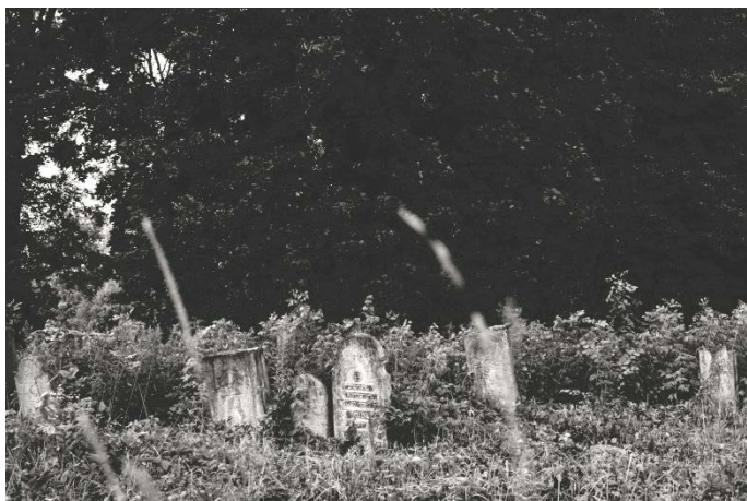
Єврейське кладовище Здолбунова. 08.07.2024 року.