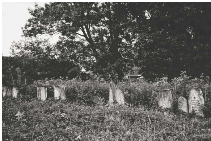
Єврейське кладовище Здолбунова. 08.07.2024 року.