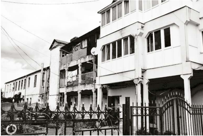
Сучасний вигляд одного з будинків, які розміщувалися на території здолбунівського гетто. Здолбунів. 08.07.2024 року.