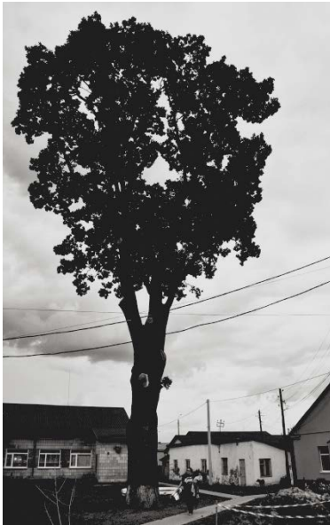
Сучасний вигляд понад столітнього дуба, що був німим очевидцем життя бранців гетто. Дуб уцілів, але не єврейська громада Здолбунова. Здолбунів. 08.07.2024 року.