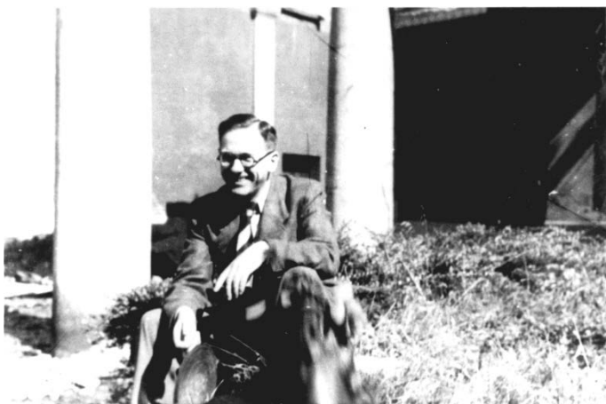
ה.פ. גרבה בזדורלברנוב בשנת 1941. ד-2520/73