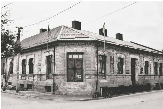
Приміщення Здолбунівського краєзнавчого музею. Під час нацистської окупації — місце перебування поста німецької жандармерії та комендатури допоміжної поліції. 08.07.2024 року.