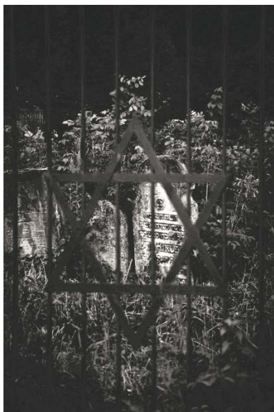
Єврейське кладовище Здолбунова. 08.07.2024 року.