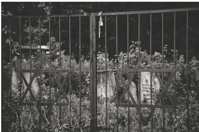
Вхід до єврейського кладовища Здолбунова. 08.07.2024 року.