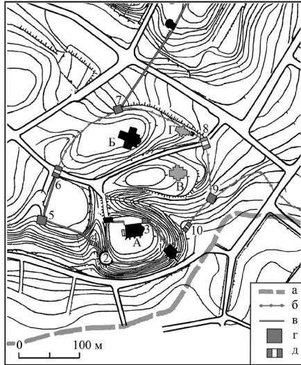
Рис. 3. Замок в Острозі в кінці XVI - першій половині XVII ст.: А - Богоявленський собор; Б - костел Успіння Богородиці; В - Успенська церква; Г - Миколаївська церква. Умовні позначення: а - старе русло р. Грабарки; б - паркан; в - кам'яна стіна; г - башта; д - брама.