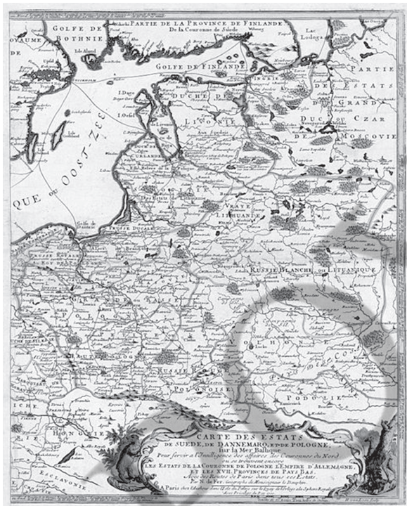
Волинь на мапі 1700 року

Під час чергового переділу Польщі в 1793 році частина земель Волині відійшла до Російської імперії. Спочатку територія була названа Ізяславським намісництвом, з центром в Ізяславі, а в 1795 році було створене Волинське намісництво, що складалося з 15 округів, з центром у Новоград-Волинському. В 1797 році губернським містом призначили Житомир, а намісництво перейменували у Волинську губернію.