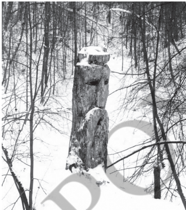
Недремний сторож священної діброви

У храмах перед кумиром головного бога жерці підтримували «вічний» вогонь, племін якого щоразу брався для розпалювання вогнищ під час жертвопринесень, для куріння пахощів під час обрядових заходів, для спалювання покійників. За погаслі багаття, поламани дерева у священних гаях жерці каралися смертю – такі випадки вважалися язичниками зловісними знаками небезпеки через гнів небожителів. Під час відзначення окремих релігійних свят (напр. Живий Четвер – Страсний Четвер у християн) племінці храмового вогню розносилися до капищ і людських помешкань. Від них запалювалися також ритуальні вогнища у священних гаях, біля рік. Поєднання двох протилежних за суттю цілющих стихій – вогню і води мало